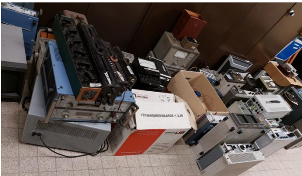
Er staat al het nodige klaar

Ook wordt het ons steeds duidelijker wat we in onze expositie allemaal willen laten zien en demonstreren. Zoals ook al gemeld in onze vorige Nieuwsbrief hebben we daarom behoorlijk wat materiaal waar we graag iemand anders een plezier mee willen doen. We zijn nu zover dat bijna alles waar we afscheid van willen nemen apart is gezet. In deze Nieuwsbrief informatie over onze verkoopdag.