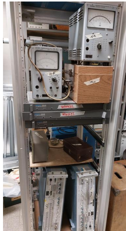
Een rek vol