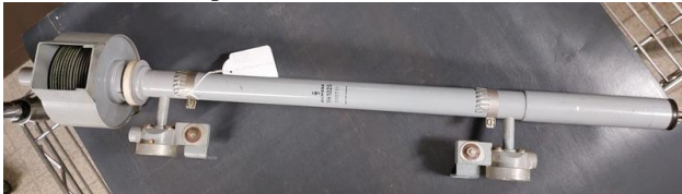
Siemens TWT type YH1020

Een lopende golfbuis is beter bekend in het Engels als Travelling Wave Tube (TWT). Een dergelijke buis, omgeven door een sterke magneet heeft over een groot frequentiegebied een hoge versterking. In de begintijd van hoogfrequent transistors werd met enkele tientallen milliwatts op de ingang van de TWT een uitgangsvermogen gemaakt van 200W voor een kleine TV zender of als een stuursignaal voor een grote 10 kW TV zender eindtrap.