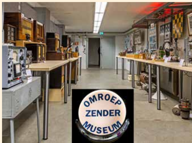
In de expositie staan zenders en ontvangers uit dezelfde periode tegenover elkaar.

De vrijwilligers van het museum leiden u graag rond en demonstreren de vele werkende apparaten. Ook kunt u radio's en TV's zien die opa en oma misschien thuis hadden.